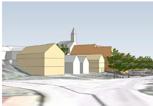
Idejna zasnova postavitve objektov 3- biro