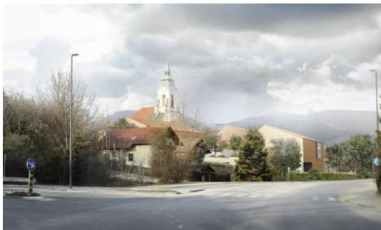
prostorski prikaz – biro Krušec