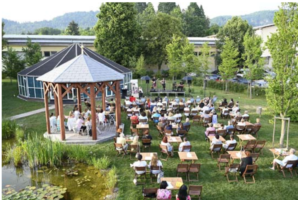
Oder na vrtu

S tem poletja v Ruski dači še ne bo konec, spremljajte program prek njihovega FB in Instagram profila. Za informacije pišite na info@ruska-daca.si , ali jim pišite na 068 646 148.