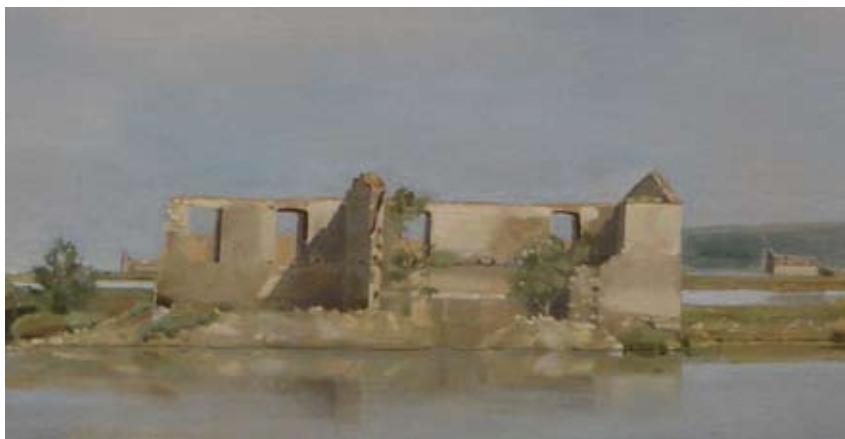
Soline, olje na leseni podlagi, 40x50, 2012 (izsek iz slike)