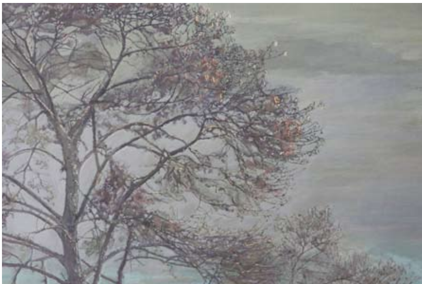
Črna jelša, tempera na leseni podlagi, 100x120 cm, 2022 (izsek iz slike)

Na likovno delavnico se prijavite po telefonu 041 955-208 (Simona Černe, dipl. slikarka).