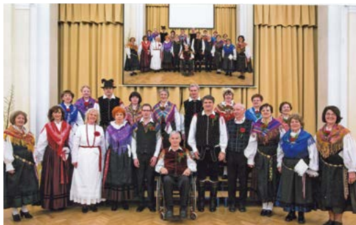
Slika zbora ob 40-letnici februarja 2015